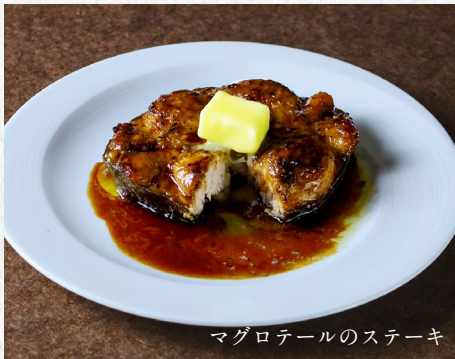
マグロテールのステーキ