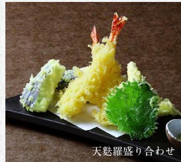
天麩羅盛り合わせ