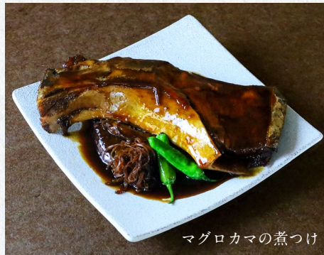
マグロカマの煮つけ