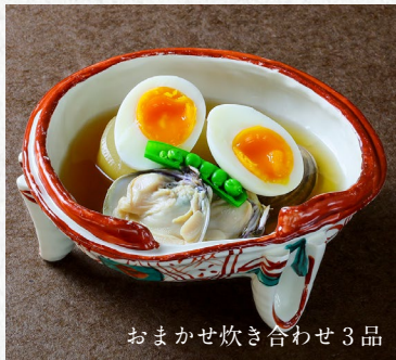
おまかせ炊き合わせ3品