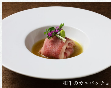
和牛のカルパッチョ